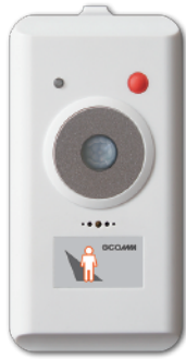
生活リズムセンサー【SW23K】

赤外線方式の人感センサーを内蔵した生活リズムセンサー。人の存在を確実にキャッチし一定時間反応がないとお知らせする機能を搭載しています。